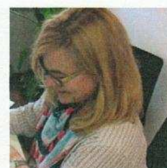
Boni Zimmermann Gestaltung