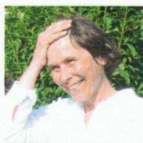
Ausstellungsmacher: Marianne Huwyler Konzept

Die Koordinationsgruppe Freiwilligenarbeit 2011 Wallisellen setzt sich zum Ziel, die Freiwilligenarbeit auf eine möglichst vielfältige Weise in der Gemeinde sichtbar zu machen.